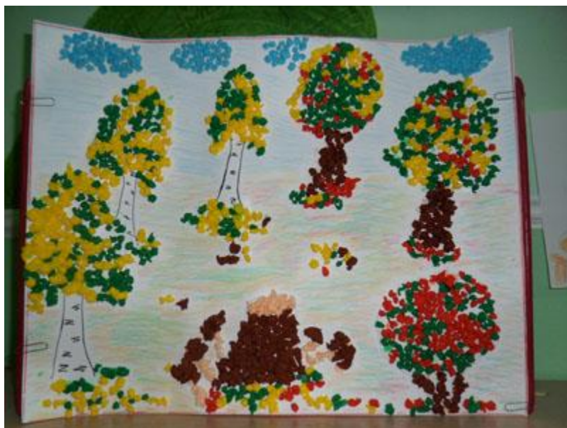
Осенняя картина (коллективная работа).