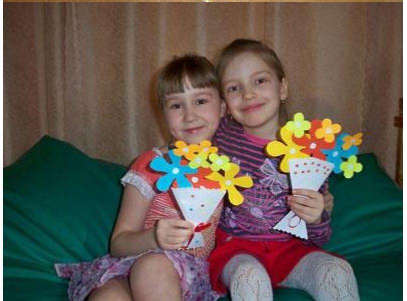
Цветы необычной красоты.